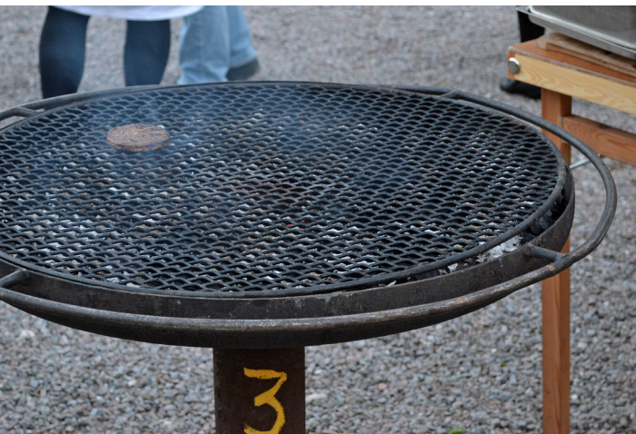
Ovan: "Rappan" har laddat upp inför anstormningen till Stångtjärn.