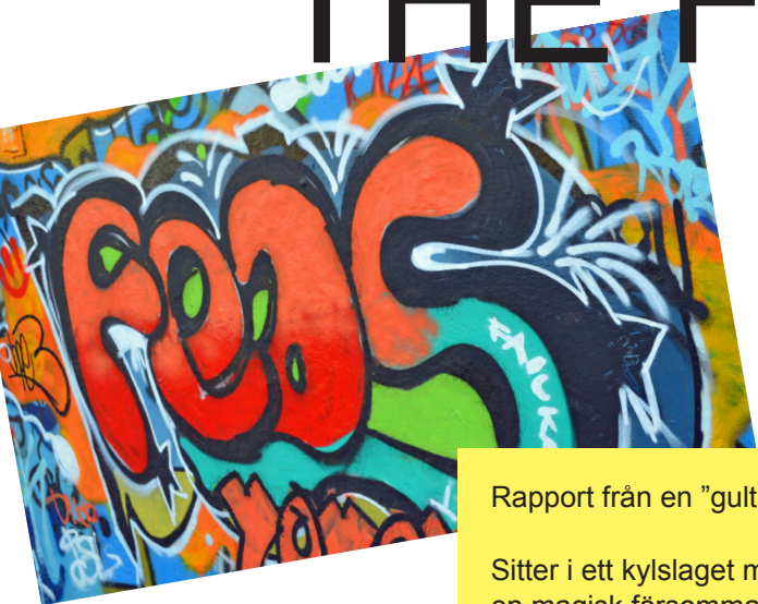
Falun i sommarskrud.