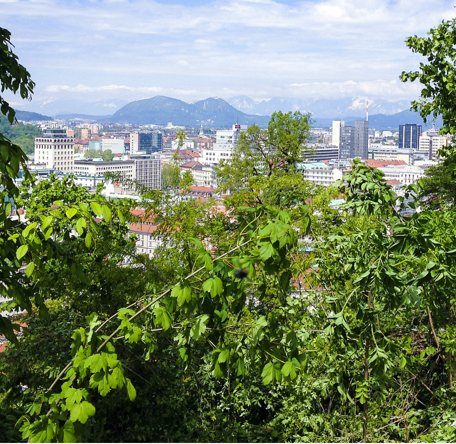
Ovan: Aprilväder i Ljubljana. Nedan till vänster: Nebotičnik. Nedan till höger: Radio String Quartet Vienna.

intressant föreläsning om vad som påverkar klangen, och han visade en film om hur strängen svänger och vad som händer när man vänder stråken. Det är rena kaoset! Inte konstigt att det är svårt att göra snygga stråkvändningar. Vi satt allihop spända på att få det ultimata tipset på vilka strängar vi ska köpa. Men han gav inget svar på hur man avgör vilka som är de bästa strängarna. Det är bara att prova och prova. Faktorerna som påverkar klangen är så många, och man kan inte räkna ut vilken kombination av strängar som är den bästa för just ditt instrument.