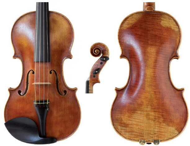
Violin "Antonio Stradivari 1716" byggd av Peder Källman

www.wennerstromsmusik.se thorbjorn@wennerstromsmusik.se Berghemsvägen 8, 443 35 Lerum Tel: 0302-147 37 eller 070-957 28 30 Pohls Fiolateljé 031-20 92 42