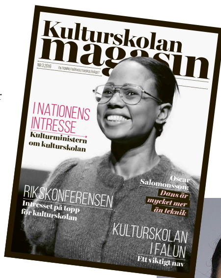
Kulturskolerådets tidning "Kulturskolan magasin".

Hon påpekade också att hon under den "korta" mandatperioden är ivrig att hinna med så mycket som möjligt. Så därför har hon föregripit Kulturskoleutredningens arbete på ett område, nämligen avgifterna i kultur- och musikskolan. Det finns flera hinder för att delta i kulturskolans verksamhet, de olika avgifterna i olika kommuner är ett av dem som är påtagligt och