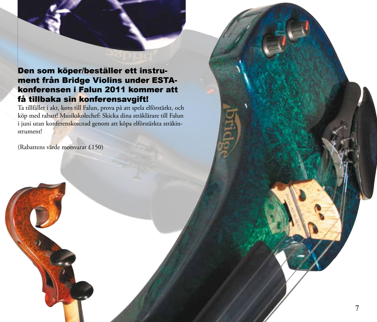
Text: Per Helder