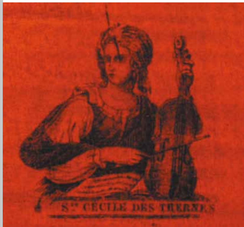
St Cecilia som hon illustrerades av Jean-Baptiste Vuillaume.

År 1584 grundades Musikaliska Akademien i Rom och med Sankta Cecilia som beskyddare uppkallades institutionen efter henne. I England inleddes traditionen 1683 i samband med bildandet av The Musical Society, som samlades just den 22 november till Gudstjänst och konsert till vilken musiken hade komponerats av Henry Purcell. Annan musik som komponerats till ära för Den Heliga Cecilia är en mässa av Alessandro Scarlatti, Messe Solennelle de Sainte Cécile av Charles Gounod och Hymn to St. Cecilia av Benjamin Britten. Många kända konstnärer har avbildat Den Heliga Cecilia, Rafael målade henne, Rubens, Domenichino, Gentileschi och Mignard likaså. Oftast porträtteras hon spelandes orgel eller cembalo