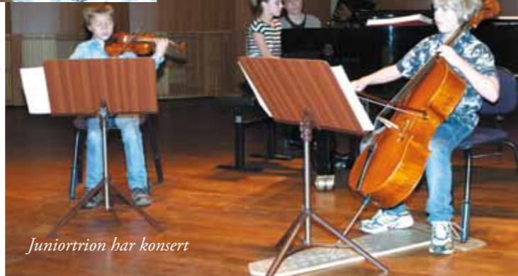
Juniortrion har konsert